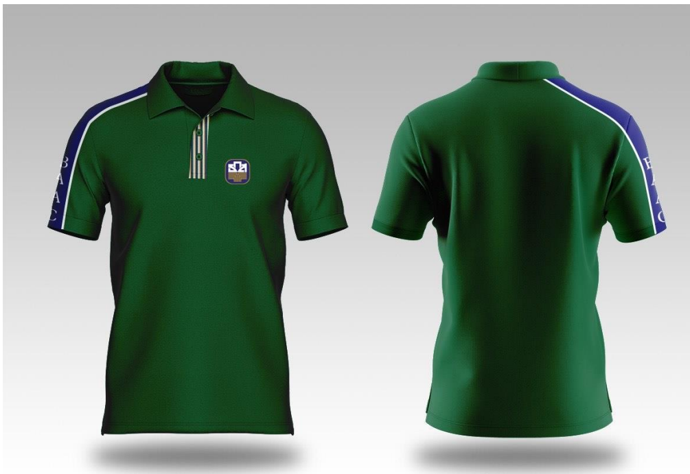
รูปภาพแบบที่ 2