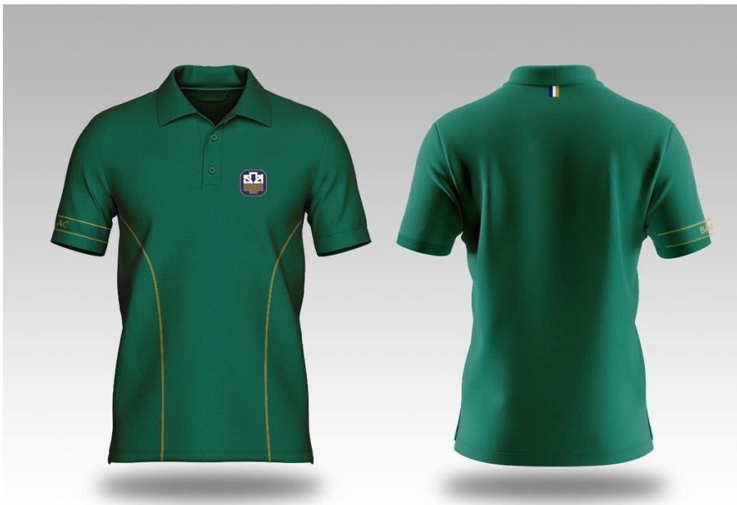
รูปภาพแบบที่ 3