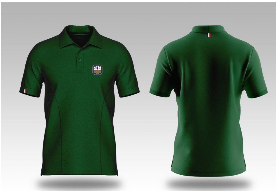
รูปภาพแบบที่ 1